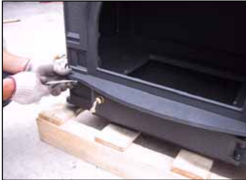
25) アッシュリップを取り付けた状態。