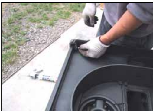
14) いまままでの工程と同様に正面を取り付け、ボルトでしっかり固定してください。