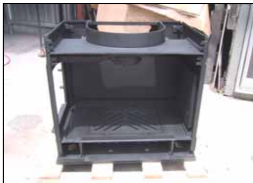
13) バックプレート サイドプレートを取り付けた状態。