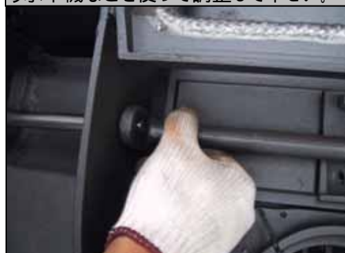
19) ダンパーアジャスターを中央の位置に置き バンパークランクにオペレーティングロッドを差し込みます。