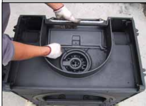
17) 次にバイパスダンパーを取り付けます。