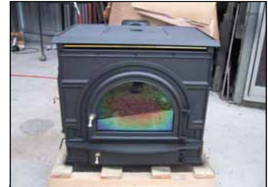
28) 新品同様の仕上がり。