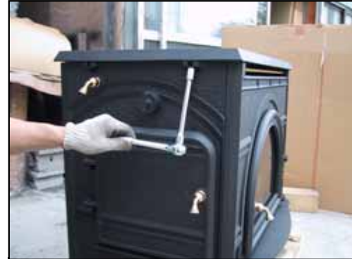
27) 天板ボルトで固定して下さい。(4箇所)