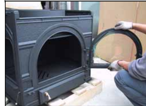
24) フロントドアを取り付けた状態。