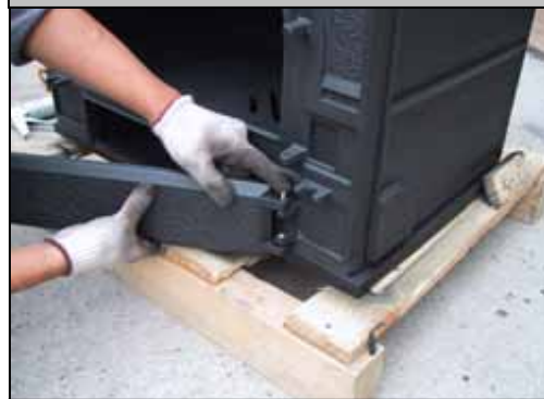
23) 灰受けドアを取り付けた状態。