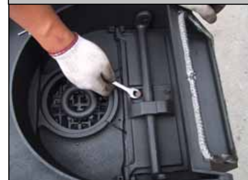
20) ダンパーアジャスターを固定します。この際、 もボルトで固定して下さい。