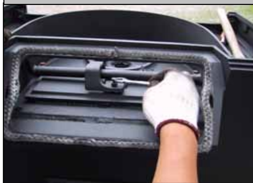
21) 次にダンパーの開閉がスムーズになるよう調整して下さい。