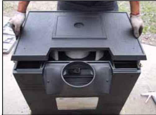
26) キャタリティックコンバスター、リフレーターパッケージをセットして天板を載せて下さい。(天板を載せる前にフルカラーをセットした方が取り付けが楽にできます)