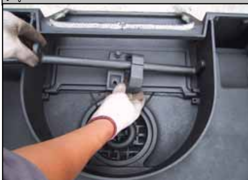
18) バンパークランクを差し込み、そこにダンパーアジャスターを通します。