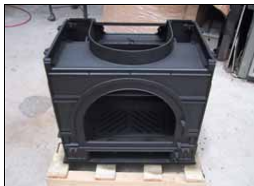
15) 全て固定した状態 この時、ストーブ本体の歪みがないよう水平機などを使って調整して下さい。