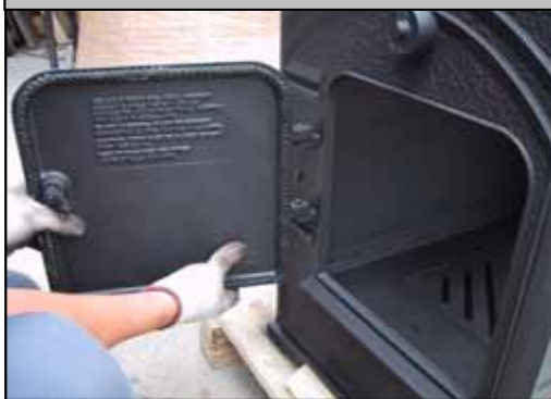
22) サイドドアを取り付けた状態。